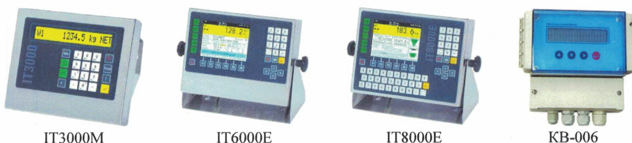
Рисунок 2 – Общий вид приборов весов